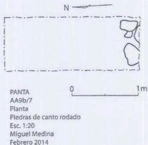
Figura 1. Planta del Lote AA9b/7 con las piedras de canto rodado.

El hallazgo de las piedras de canto rodado al sur de la Operación asentadas en el Lote AA9b/7 podría indicar una escalinata o rampa de acceso a la Terraza 3. Limitándonos a los objetivos del programa de investigación, no se descubrirá más este rasgo al sur, lo cual requiere una extensión de la Operación, pues solo se está sondeando el área en busca de posibles sectores habitacionales menores alrededor del Grupo Central del sitio. Se hace la sugerencia de excavar este rasgo en futura oportunidad porque podría brindar información importante sobre este sector de dicha terraza.